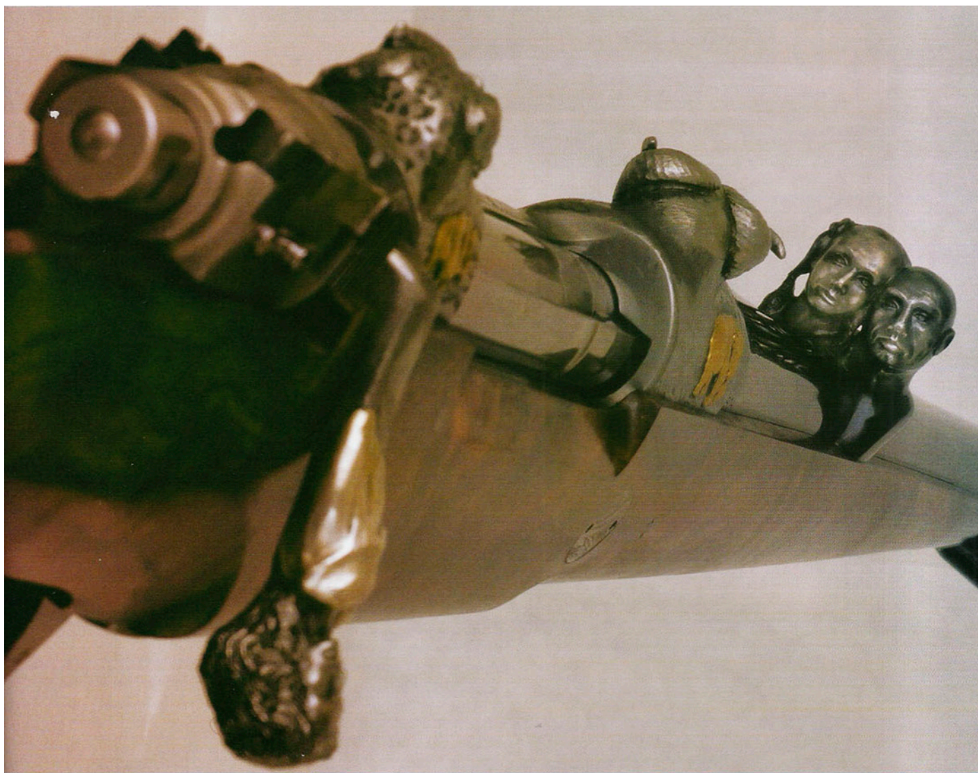
Conjunto escultórico de miras, con una terminación verdaderamente impactante. Nótese también el trabajo escultórico sobre el asa del cerrojo.

mayor precio del mercado, no son caras, pues son verdaderas obras de arte refinadas. Piezas irrepetibles surgidas de las manos del hombre para honrar a su poseedor, mostrar la admiración de éste por las armas y perpetuar el genio artesanal.