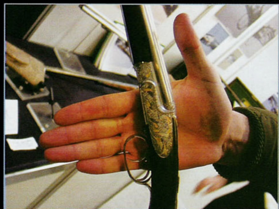
Éste es un express "de verdad" que dispara un cartucho pequeño y tiene la misma calidad de acabados y terminación que el más exquisito de los express grandes.