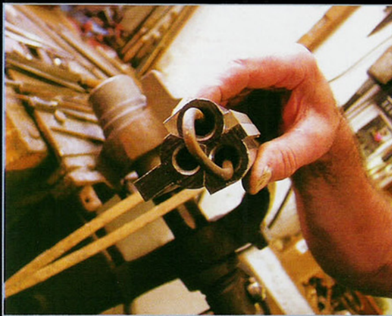
Todo, menos el ánima, se fabrica a mano en estas armas. Se lima, se ajusta, se suelda y se ensambla de la forma más artesanal.

Así, las piezas de Peter Hofer, aun cuando se las identifica como las de