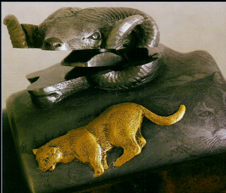
Aunque a primera vista dé esa impresión, no está roto. En la montura del visor está lo que falta de la cabeza del muflón, que se completa al montarlo. Una idea admirable.