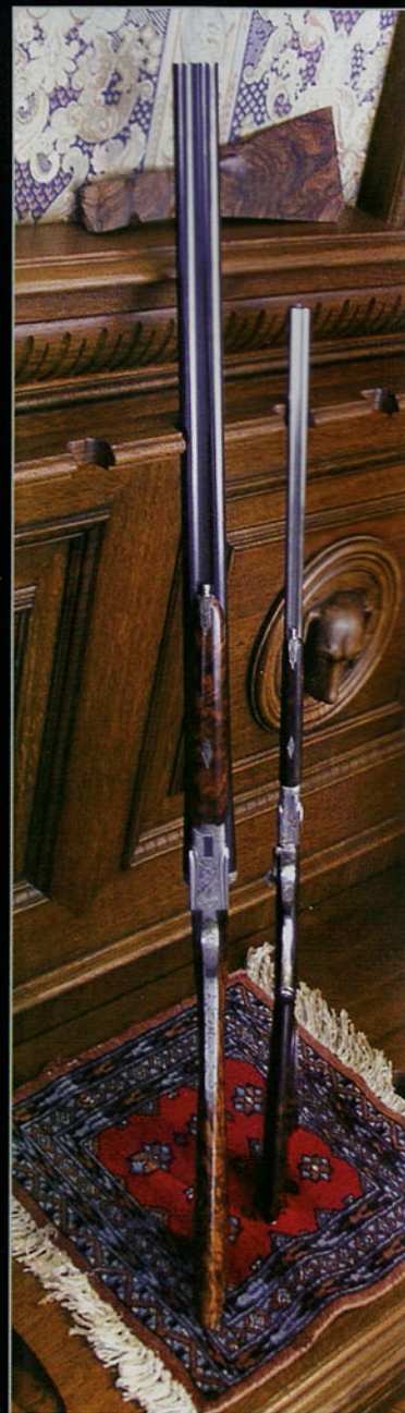
Junto a una escopeta normal apreciamos las reducidas dimensiones de este express totalmente funcional en calibre pequeño.

Se desarrollan también sistemas y mecanismos propios de la casa