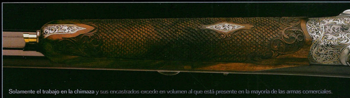
Solamente el trabajo en la chimaza y sus encastrados excede en volumen al que está presente en la mayoría de las armas comerciales.

Nacido en 1958, estudió Bellas Artes y Artesanía en Ferlach. Al tiempo, en 1979 se graduó como maestro armero y técnicas del metal. En 1986 creó su propia empresa con la concreta intención de desarrollar el diseño y la creación y, como él mismo dice, "en busca de la perfección". Para poder mantener esta filosofía, su actividad, desde el principio, estuvo orientada hacia clientes selectos dispuestos a pagar la calidad, el arte y la exclusividad que ofrece en cada una de sus armas. Puede afirmarse sin